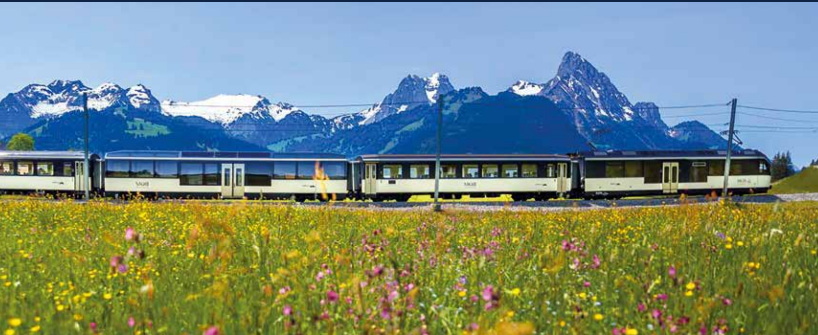
Zwischen Blumenwiesen und Bergblick – unterwegs im GoldenPass Panoramic