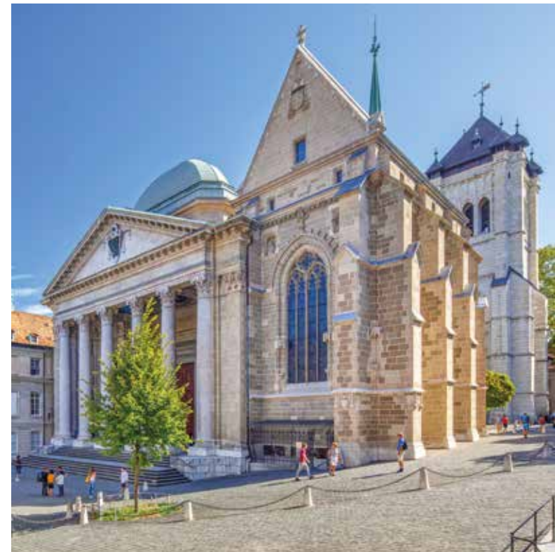
Die Kathedrale St. Peter mit klassizistischer Säulenfront