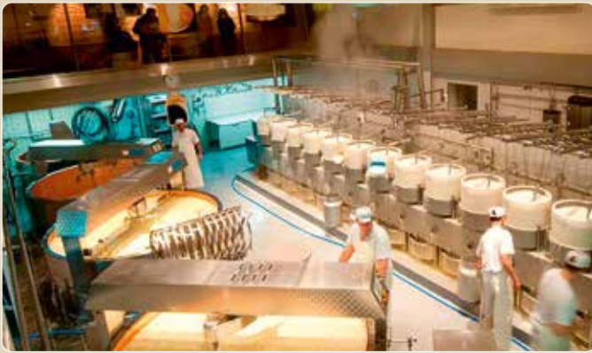
Einblick in die Produktionshalle