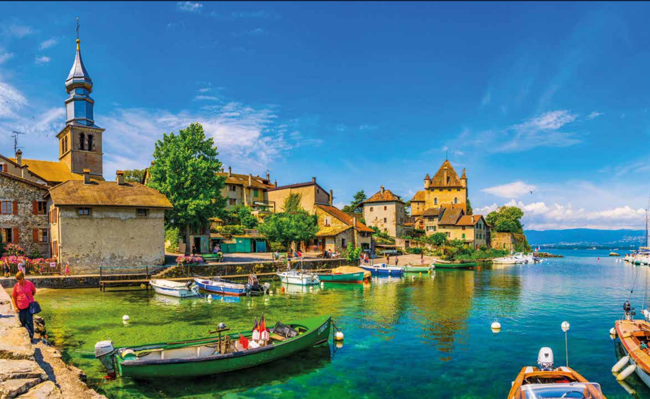
Am Wasser gelegen und geschichtsträchtig – das Schloss von Yvoire