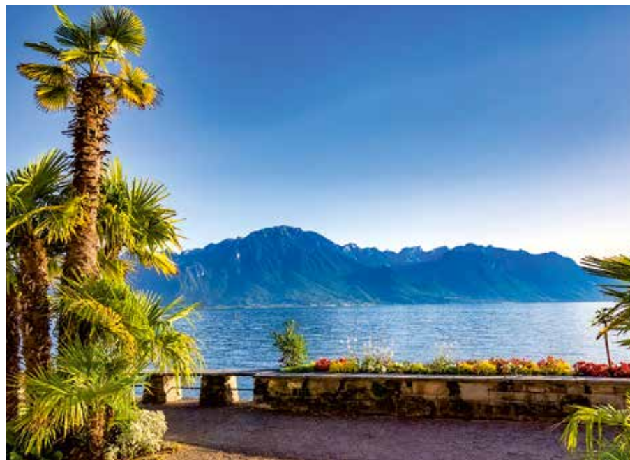
Palmen am Genfersee – mediterranes Flair vor Alpenkulisse

Montreux liegt eingebettet zwischen steilen Rebhängen und dem Ufer des Genfersees, im Hintergrund ragen die schneebedeckten Alpen auf. Beim Spaziergang entlang der Uferpromenade fällt der Blick immer wieder auf den glitzernden See und die prachtvollen Häuser aus der Zeit der Belle Époque – ein Panorama wie gemalt.