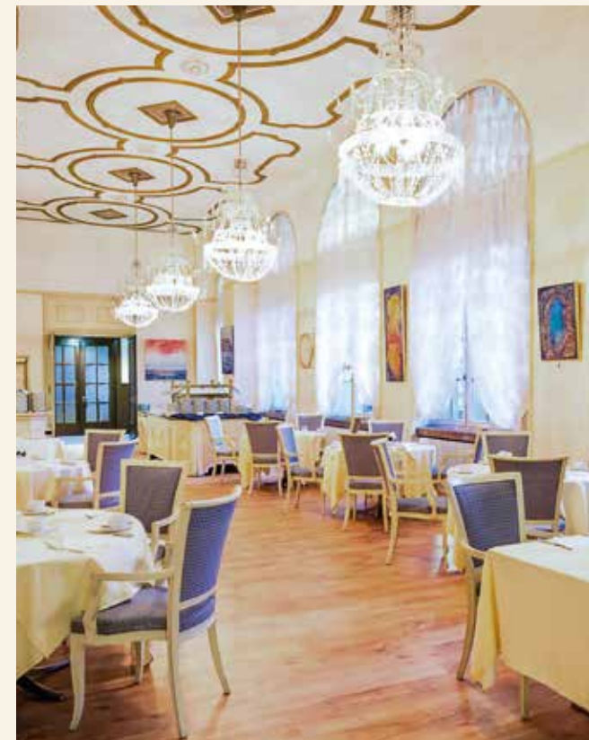
Frühstück im stilvollen Ambiente des Schlosshotels

Expedia: „Hervorragend“, Stand: Juni 2026