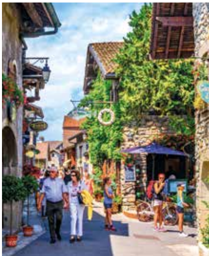
Das Bilderbuchdorf Yvoire

An Bord eines dieser charmanten Schiffe entdecken wir den Genfersee aus einer neuen Perspektive