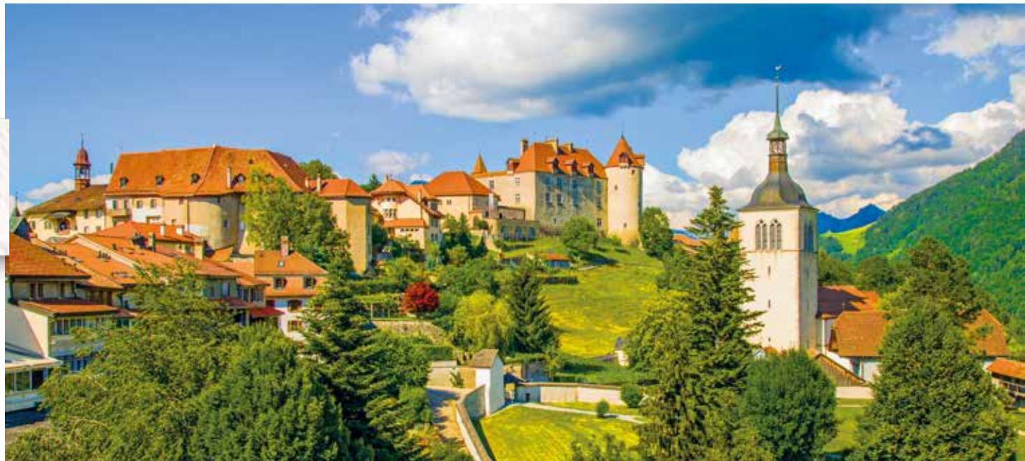
Gruyères im Kanton Freiburg ist eines der schönsten Städtchen der Schweiz