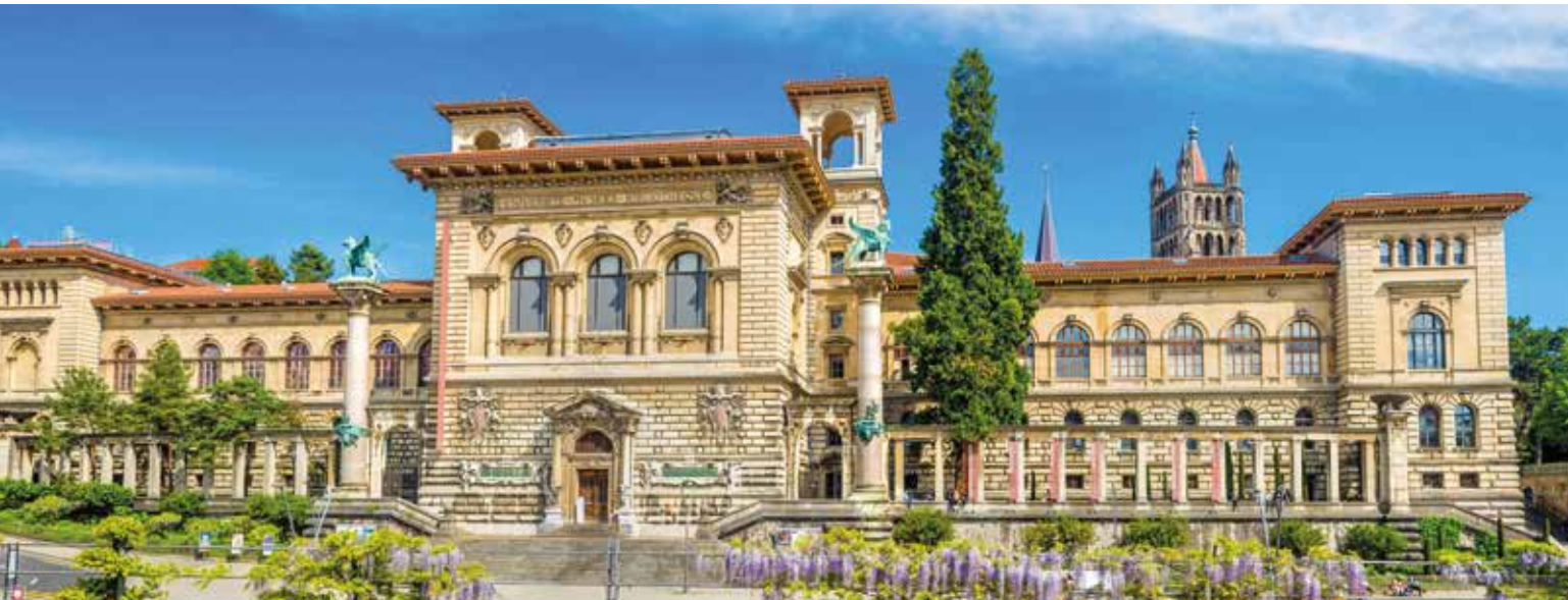
Palais de Rumine – ein Schmuckstück im Stil der Florentiner Renaissance