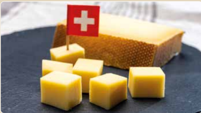
Von mild zu kraftvoll – Geschmack mit Entwicklung

Für Entdecker des feinen Geschmacks – Käse in Vollendung