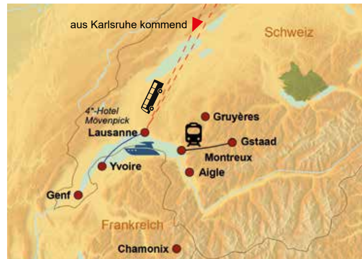
Alle Orte im Überblick – die Karte zu unserer Reise