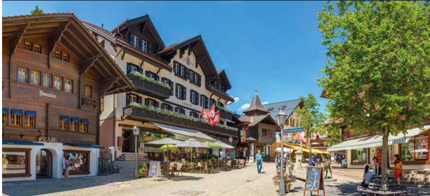
Die Häuser in Gstaad sind dem Chalet-Stil nachempfunden, was dem Ort seinen einzigartigen Reiz verleiht

In Gruyères hat man das Gefühl, als wäre die Zeit im Mittelalter stehen geblieben. In der Schaukäserei erfahren wir alles über die Herstellung des würzigen Gruyère-Käses, eine Tradition, die seit Generationen weitergegeben wird. Eine interaktive Ausstellung nimmt uns mit auf eine Reise für die Sinne: Düfte von Heu und Alpenblumen schaffen Atmosphäre, während wir uns auf kleine Kostproben des Käses in verschiedenen Reifestufen freuen dürfen.