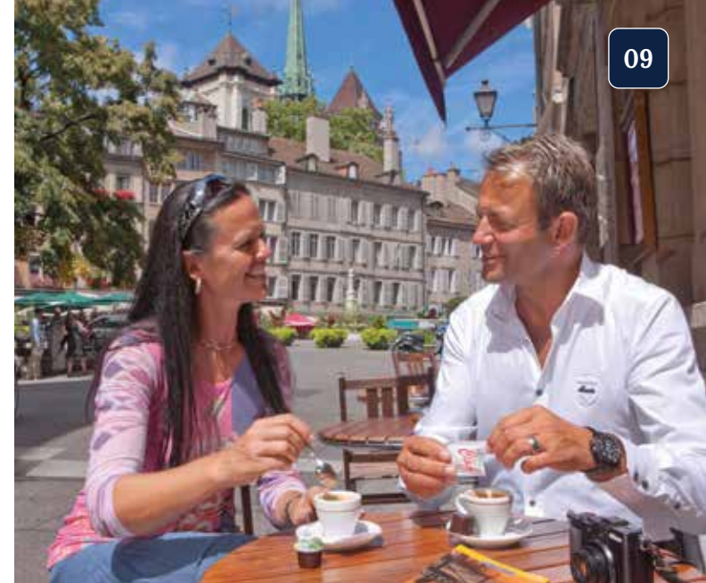
Freizeitipp: Cafézeit in der Genfer Altstadt

Zugleich bewahrt die Stadt ihren eigenen, unverwechselbaren Charme. Bei unserer Stadtführung durch die Genfer Altstadt folgen wir den Spuren der Geschichte. Wir passieren ehrwürdige Bürgerhäuser und immer wieder öffnet sich der Blick auf den weiten, tiefblauen Genfersee.