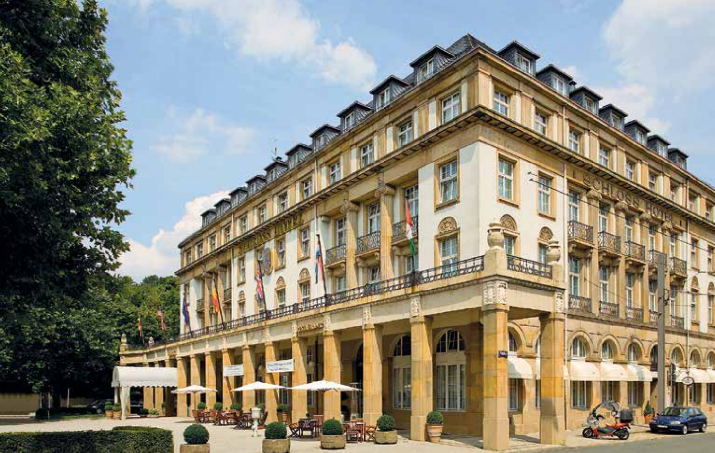
Ein Hauch Belle Époque – die markante Fassade des Schlosshotels