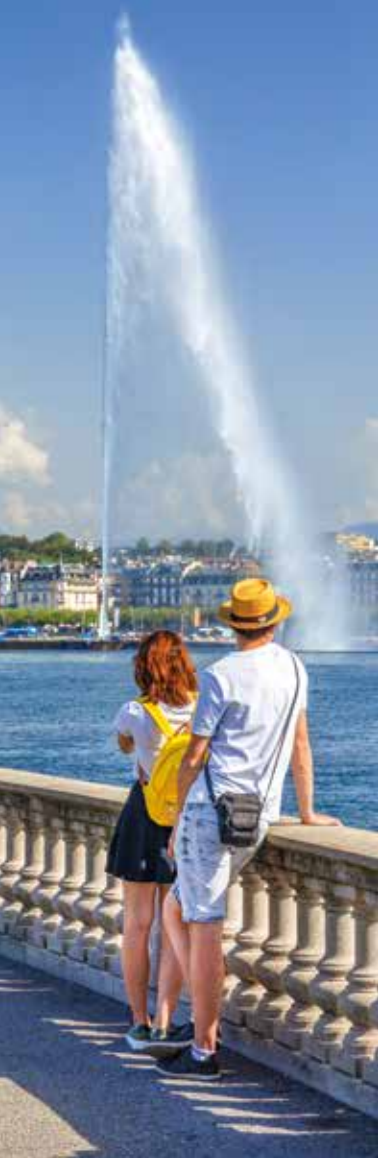
Wasserfontäne in Genf