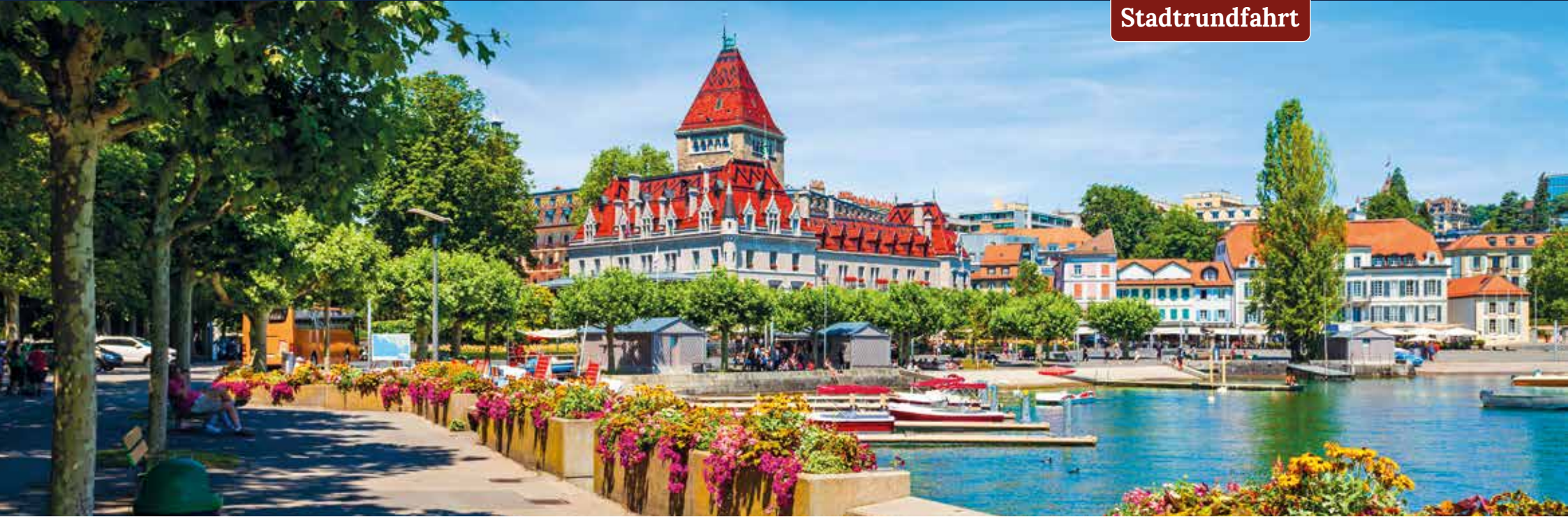
Genießen Sie Mittelmeer-Impressionen, die sich bei einem Bummel entlang der Promenade in Lausanne-Ouchy präsentieren